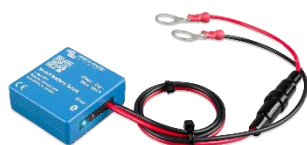
Détection Bluetooth Smart Battery Sense