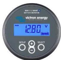
Détection Bluetooth BMV-712 Smart Battery Monitor