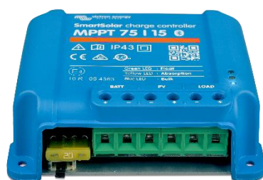
Contrôleur de charge SmartSolar MPPT 75/15